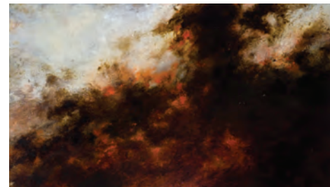
Braises n° 2, 2010