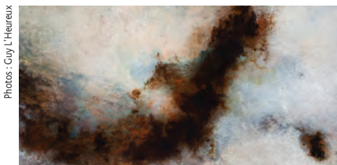
La coulée n° 1, 2009