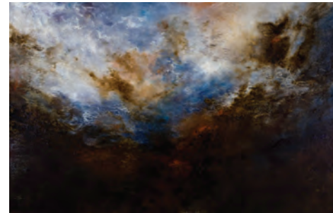
Avant n° 1, 2010